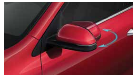
Электропривод складывания боковых зеркал

Расположение парковочных датчиков сзади и спереди облегчает парковку и маневрирование в ограниченном пространстве.