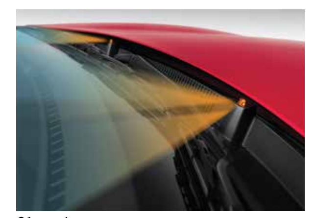
Обогрев форсунок стеклоомывателя Больше не надо очищать зеркала от наледи при низких температурах.