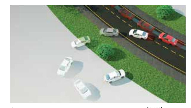
Система контроля торможения в поворотах (СВС)

Каждый автомобиль Кіа сконструирован так, чтобы обеспечить вам полную безопасность в пути. Прочный кузов, на 50% состоящий из высокопрочной стали AHSS, 6 подушек безопасности для водителя и пассажира, отличная управляемость обеспечивают вашу защищенность на дороге.