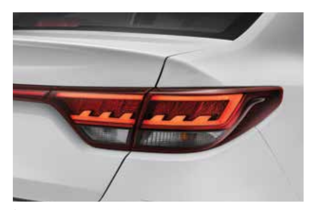
Задние светодиодные фонари