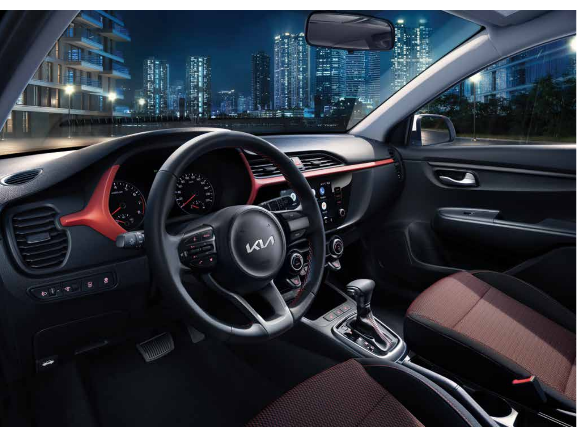
Рулевое колесо и селектор трансмиссии с контрастной красной прострочкой

Добавьте в вашу жизнь яркости и незабываемых впечатлений вместе с Kia Rio в комплектации Style.