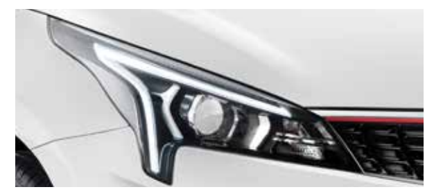
Передние проекционные фары со светодиодными дневными ходовыми огнями

Для тех, кто хочет еще более яркого и вдохновляющего вождения, мы создали Kia Rio в версии Style с энергичным характером и эффектными акцентами в дизайне.