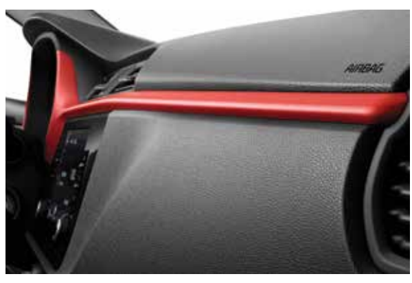
Красный декоративный молдинг