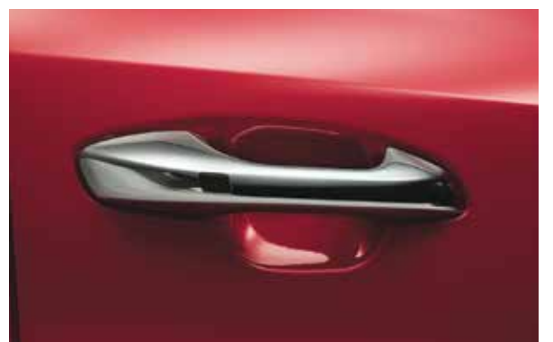
Хромированные ручки дверей Элегантные детали в экстерьере Kia Rio.