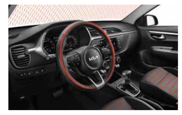
Обогрев руля Чтобы нагреть руль до комфортной температуры, просто нажмите кнопку.