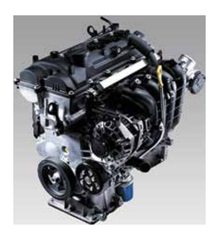
Двигатель 1.6 Gamma

Двигатель и трансмиссии Kia спроектированы с учетом казахстанских условий. Какой бы ни была дорога, вы будете чувствовать себя уверенно за рулем.