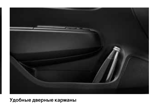
В них можно много всего положить. Например, бутылку с водой и небольшой зонтик.