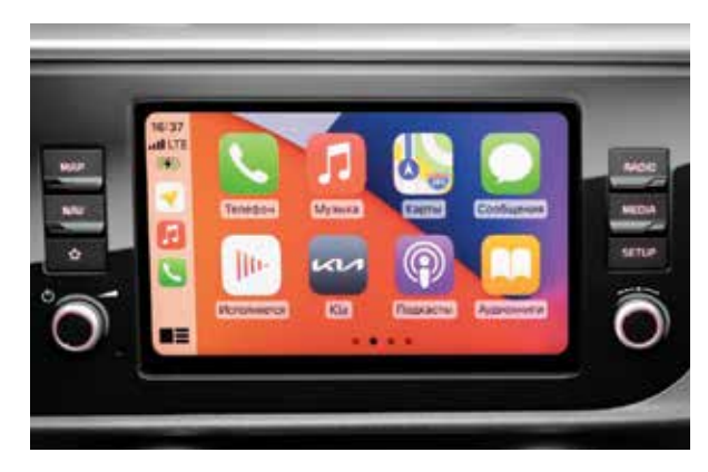
Новая мультимедийная система с 8" дисплеем