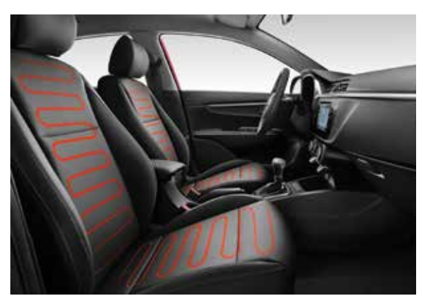
Обогрев передних сидений Комфортная температура даже в сильные холода.