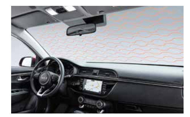
Обогрев лобового стекла Позволяет очистить стекло от снега и льда еще до начала поездки.