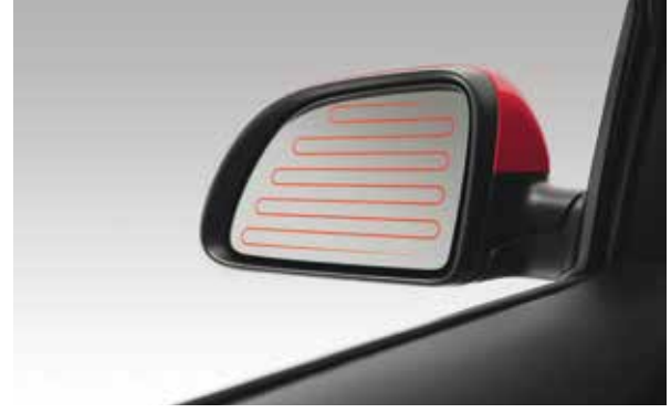
Обогрев боковых зеркал Ваши зеркала всегда будут чистыми от наледи на парковке и во время поездки.