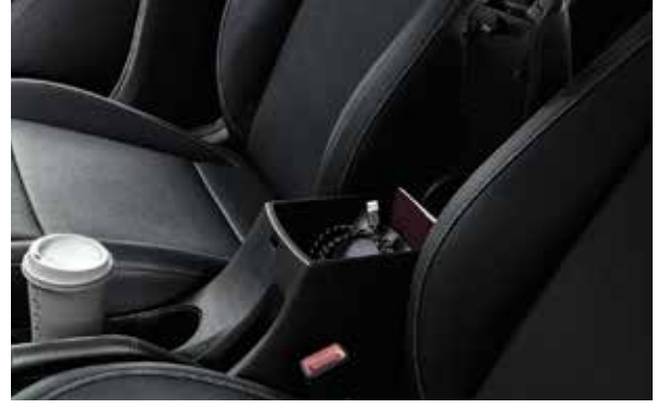
Бокс для мелких вещей Под подлокотником вы найдете бокс для полезных мелочей.