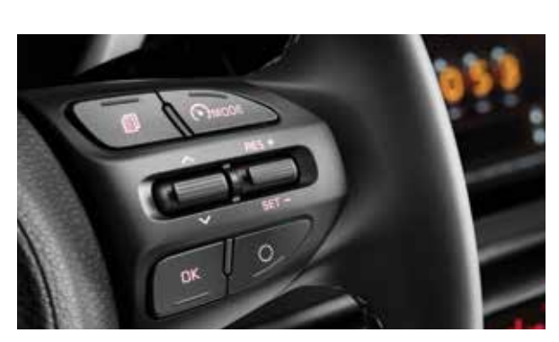
Круиз-контроль с ограничением скорости

Во время парковки можно сложить боковые зеркала одним нажатием кнопки.