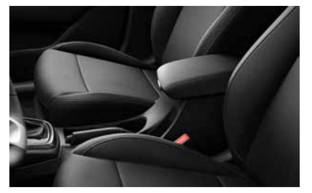
Эргономичный подлокотник Можно удобно расположить на нем руку или использовать как подстаканник.