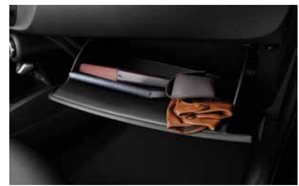
Перчаточный ящик Идеальное место для всех необходимых в дороге мелочей.