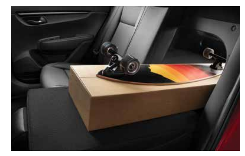
Задние складывающиеся сиденья

Для безопасности самых маленьких пассажиров предусмотрено крепление для детского сиденья ISOFIX.