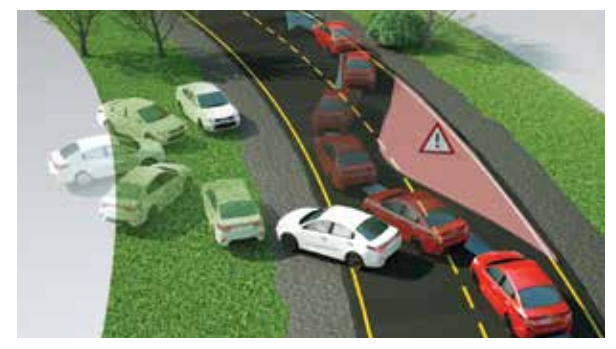
Интегрированная система контроля устойчивости (VSM)

Позволяет увереннее проходить повороты, не уходя в занос.