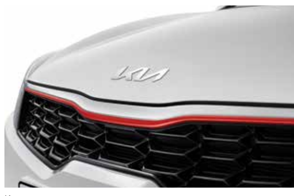
Красные спортивные акценты на решетке радиатора