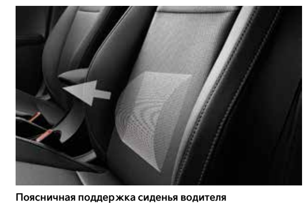
с электрорегулировкой Создайте максимально удобную для вас конфигурацию сиденья.