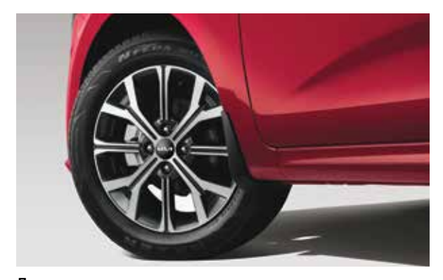
Литые диски Новые легкосплавные диски диаметром 16".