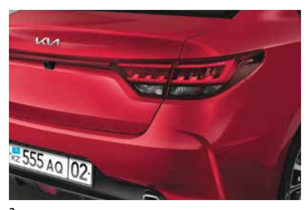
Задняя светотехника Задние фонари и линия между ними объединены в общую композицию.