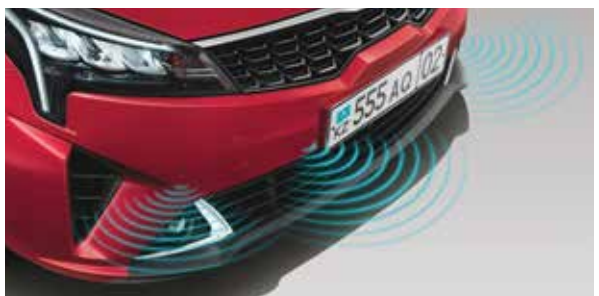
Передние и задние парковочные датчики

Расположение парковочных датчиков сзади и спереди облегчает парковку и маневрирование в ограниченном пространстве.