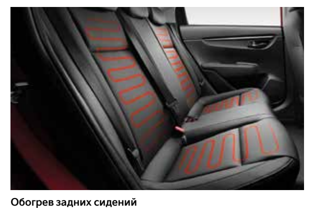
Тепло для каждого пассажира на заднем ряду.