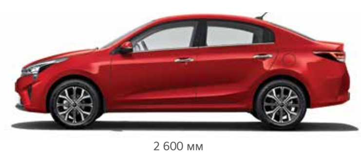
4 420 MM