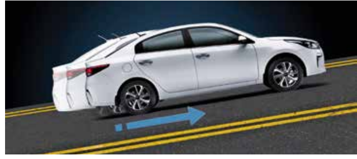
Система помощи при старте на подъеме (НАС)

В экстренных случаях операторы свяжутся с вами, а при необходимости вызовут службы экстренной помощи.