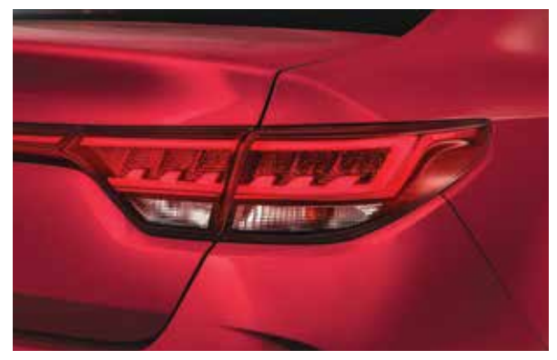
Задние светодиодные фонари Оригинальный рисунок задней оптики добавляет выразительности во внешний вид автомобиля.