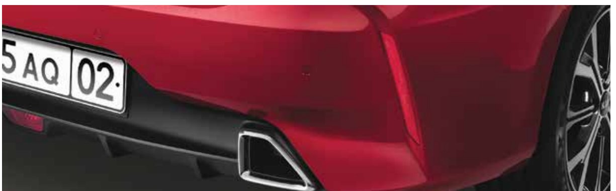
Задние светоотражатели Эффектные вертикальные светоотражатели – заметный штрих в экстерьере.