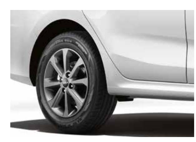
Темные легкосплавные 15" диски и задние дисковые тормоза