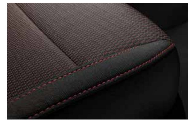
Тканевая отделка сидений с контрастной красной прострочкой