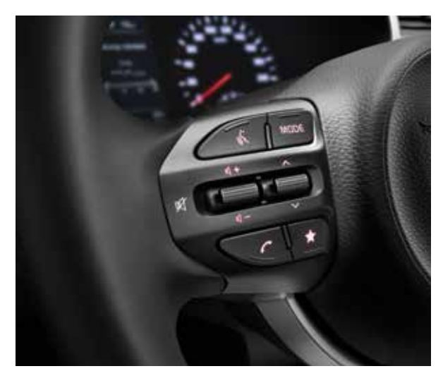
Многофункциональное рулевое колесо

Позволяет управлять аудиосистемой, круиз-контролем и Bluetooth, не отрываясь от дороги.