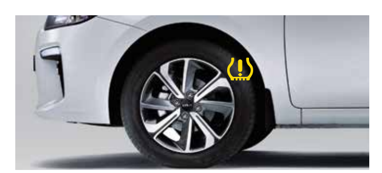
Система контроля давления в шинах

При трогании с места на подъеме система автоматически удержит автомобиль с помощью тормозов, чтобы предотвратить его скатывание назад.